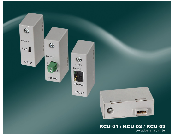
KCU-01 / KCU-02 / KCU-03 www.kutai.com.tw